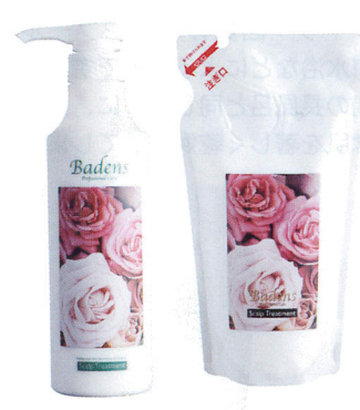
バーデンス アロマトリートメント (9種の香り)