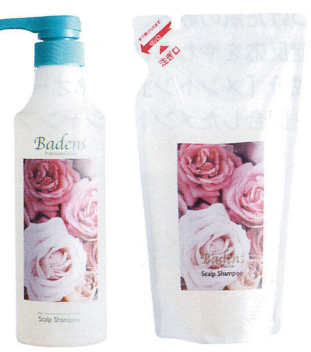
バーデンス アロマシャンプー (9種の香り)