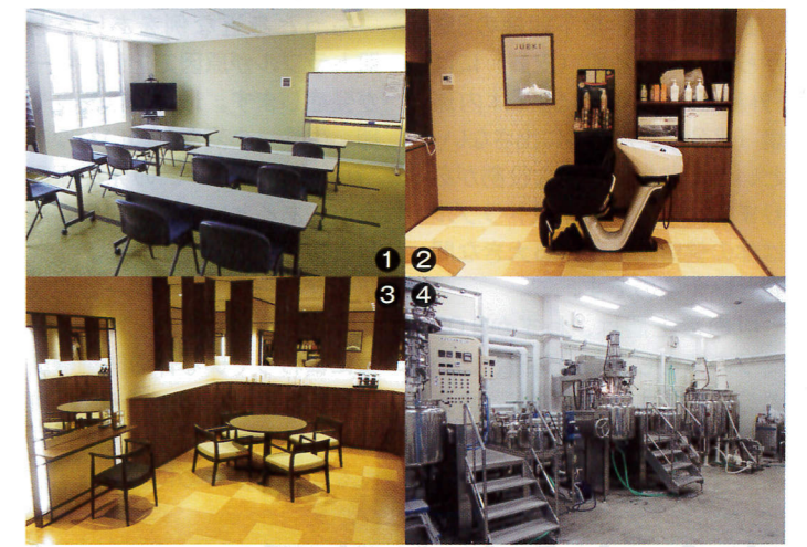
①広々とした研修室 ②③体験できるサロンルーム ④充実した設備の新工場

また、新しい工場では製造している現場を見学できるコースはもちろん、モアコスメティックスの製品を実際のお店のような雰囲気でも体験していただく