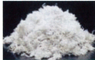
アスベスト (化学式 3MgO \cdot 2SiO_2 \cdot 2H_2O ) 住宅建材として広く使われてきた天然鉱石。中皮腫や肺ガンなど、人体への健康被害が大きな社会問題になり使用禁止になった。