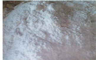
タルク (化学式 3MgO \cdot 4SiO_2 \cdot H_2O ) 柔らかい天然鉱物で、ベビーパウダーやファンデーションなどの主原料として利用。アスベストと成分が非常に似ている。

モアコスメティックスは、このタルクを排除するために、安全性の高いすべて合成のファンデーション原料、モアパウダーを開発して、〈粧う〉化粧品に配合しています。